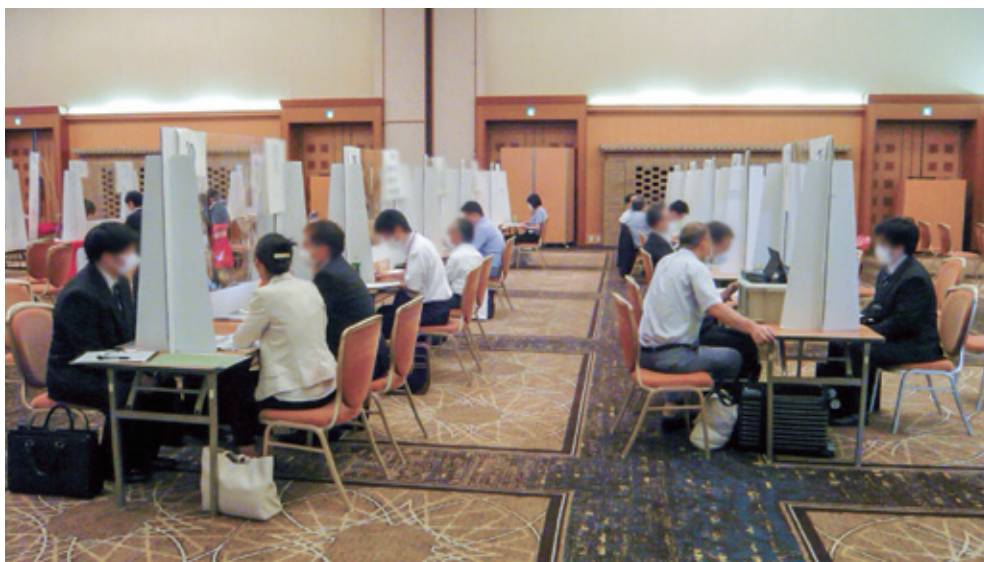
チャレンジいばらき就職面接会（水戸会場）の様子 県内各地で「就職面接会」を開催しています。詳しくは中面をご覧ください。