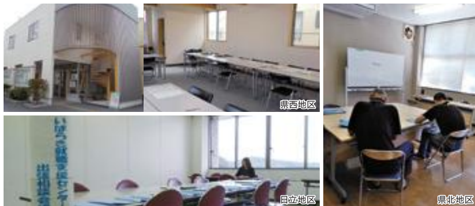
出張相談会場の様子

各地区就職支援センターでは、毎月、出張相談を開設しています。詳しくは誌面をご覧ください。