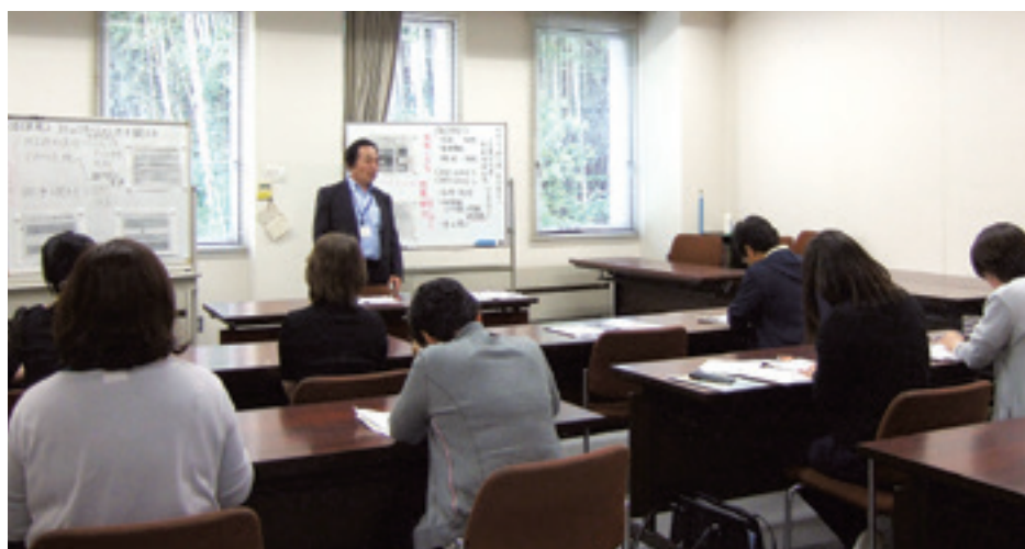
いばらき就職支援センター オープンセミナーの様子