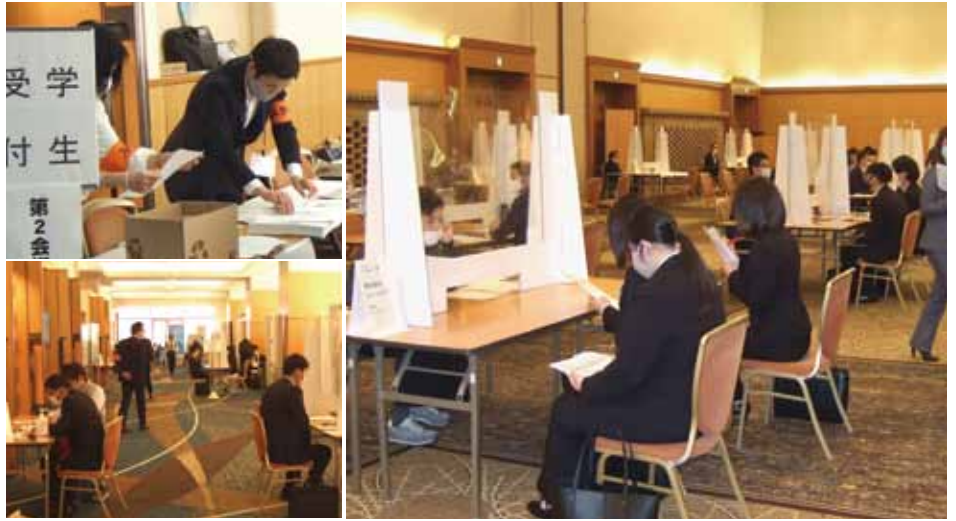
チャレンジいばらき就職面接会（水戸）の様子