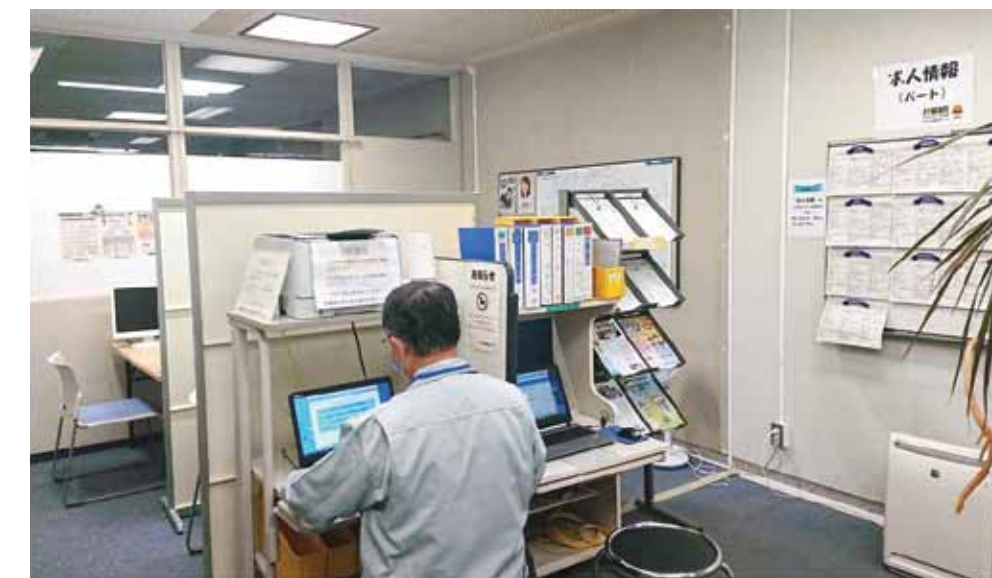
県西地区就職支援センター