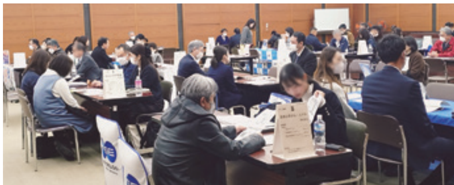
元気いばらき就職フェアの様子